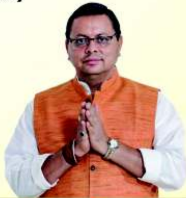
पुष्कर सिंह धामी मुख्यमंत्री, उत्तराखण्ड