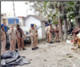
भेजने की कार्रवाई की जा रही है। जानकारी के अनुसार हिंदूवादी संगठन के कार्यकर्ताओं की सूचना पर कोतवाली पुलिस की टीम ने यूपी बार्डर के पास एक ट्रक को पकड़ लिया। तलाशी लेने पर उसमें दस गायें बरामद हुयीं। ट्रक में सवार तीन लोगों को हिरासत में लेकर उनसे पूछताछ की जा रही है। (शेष पृष्ठ सात पर)

रुद्रपुर (उद संवाददाता)। यूपी बार्डर के पास पुलिस ने एक सूचना के बाद गायों से भरा ट्रक पकड़ लिया। इसमें दस दुधारू गायें भरी थी। पुलिस ने वाहन को कब्जे में लेने के साथ ही तीन लोगों को हिरासत में लिया है। गायों को गोशाला