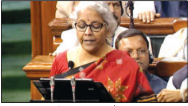
आय वालों को भी कोई टैक्स नहीं देना पड़ता है। केंद्र सरकार ने मोबाइल फोन मैन्युफैक्चरिंग को लेकर भी बड़ा एलान किया है। बजट 2023 के लागू होने के बाद देश में मोबाइल फोन्स सस्ते हो सकते हैं। सरकार ने मोबाइल फोन्स में इस्तेमाल

5 टैक्स स्लैब होंगे। न्यू टैक्स रीजिम में 15.5 लाख तक की इनकम पर 52500 रुपये स्टैंडर्ड डिडक्शन कर दिया गया है। 2022 के बजट में सरकार ने टैक्स स्लैब में कोई बदलाव नहीं किया था। न तो राहत दी गई थी और न ही बोलें बढ़ाया गया था। मौजूदा समय पांच लाख रुपये तक की शुद्ध कर योग्य आय वाले व्यक्ति को पुराने और साथ ही नई कर प्रणाली दोनों में धारा 87ए के तहत 12,500 रुपये तक की कर छूट का लाभ मिलता है। मतलब ऐसे लोग 87ए के तहत अलग-अलग निवेश दिखाकर आयकर से छूट हासिल कर लेते हैं। ऐसे में पांच लाख तक की