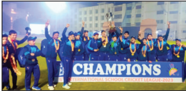
स्थित मैदान में एमेनिटी पब्लिक स्कूल उत्तराखंड एवं बाल भवन इंटरनेशनल स्कूल दिल्ली के बीच खेला गया। एमेनिटी ने यह मैच 60 रन से जीतकर ट्रॉफी अपने नाम कर ली। टॉस जीतकर एमेनिटी की टीम ने बल्लेबाजी करने का निर्णय लिया। निर्धारित 20 ओवर