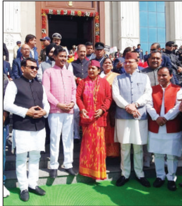
विधानसभा सत्र में जाते सीएम, विधानसभा अध्यक्ष एवं अन्य

नारेबाजी की। विधायक वेल पर पहुंच गए। सत्र शुरू होने से पहले कांग्रेसी विधायकों ने विधानसभा परिसर में धरना