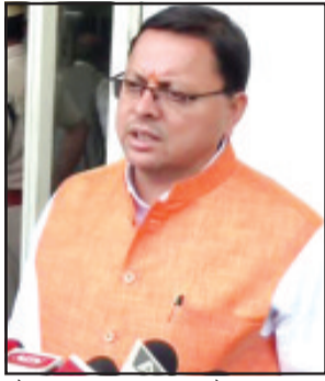
उत्तराखंड में फिल्म 'द केरल स्टोरी' को सरकार ने कर मुक्त करने का ऐलान कर दिया है।

देहरादून (उद संवाददाता)। उत्तराखंड में फिल्म 'द केरल स्टोरी' को सरकार ने कर मुक्त करने का ऐलान कर दिया है। मध्यप्रदेश के बाद अब उत्तराखंड में भी फिल्म "द केरल स्टोरी" को करमुक्त किया जाएगा। उत्तराखंड में भी फिल्म "द केरल स्टोरी" को टैक्स फ्री किया जाएगा। कैबिनेट मंत्री सतपाल महाराज ने इस बारे में जानकारी दी है। पत्रकारों से वार्ता के दौरान कैबिनेट मंत्री सतपाल महाराज ने ये बात कही है। इसके साथ ही मंगलवार को सीएम पुष्कर सिंह धामी हाथीबड़कला स्थित सेंट्रियो मॉल में फिल्म 'द केरला स्टोरी' देखेंगे। सीएम ने कहा कि फिल्म 'द केरला स्टोरी' में दिखाया गया है कि कैसे बिना बंदूक