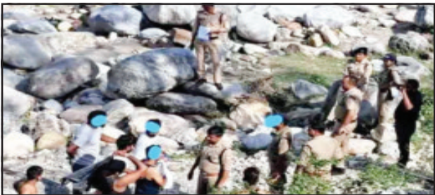
विशेष अभियान ऑपरेशन मर्यादा के तहत यह कार्रवाई की ताकि यह सुनिश्चित किया जा सके कि पर्यटन स्थलों पर पर्यटकों और आगंतुकों द्वारा प्रोटोकॉल

देहरादून (उद संवाददाता)। उत्तराखंड में पर्यटन के लिए आना हो तो आपको मर्यादा में रहकर आचरण करना होगा नहीं तो पुलिस ऑपरेशन मर्यादा के तहत कार्यवाही करने से नहीं हिचकेंगी। देहरादून पुलिस ने सोमवार को सार्वजनिक स्थान पर शराब पीने और क्षेत्र में गुंडागर्दी करने के आरोप में रायपुर प्रखंड के सोंग नदी के पास मालदेवता से 16 लोगों को गिरफ्तार किया है। अधि कारियों ने कहा कि पुलिस ने अपने