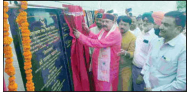
कैबिनेट मंत्री सतपाल महाराज ने काशीपुर में किया करोड़ों की लागत की विभिन्न योजनाओं का लोकार्पण व शिलान्यास

ब्लॉक सभागार में आयोजित कार्यक्रम के लघु सिंचाई विभाग के अंतर्गत 35 करोड़ 48 लाख 38 हजार रुपए की विकास