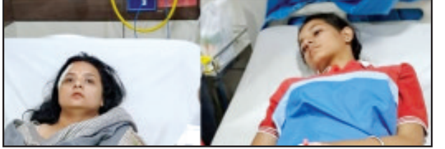
विद्यालय में कार्यरत चतुर्थी श्रेणी महिला कर्मि की चपेट में आकर मृत्यु हो गई जबकि बस में सवार दर्जनों बच्चे घायल हुए जिन्हें उपचार के (शेष पृष्ठ सात पर)

काशीपुर (उद संवाददाता)। स्कूली बच्चों को लेकर पिकनिक पर जा रही एक बस उत्तर प्रदेश के ददियाल इलाके में अनियंत्रित होकर पलट गई। इस दौरान