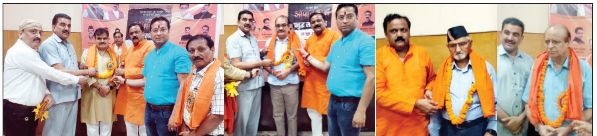
रुद्रपुर में भारतीय जनता पार्टी द्वारा आयोजित आपातकाल प्रबुद्ध सम्मेलन में आपातकाल के दौरान जेल जाने वाले नगर के प्रमुख लोगों को सम्मानित किया गया।