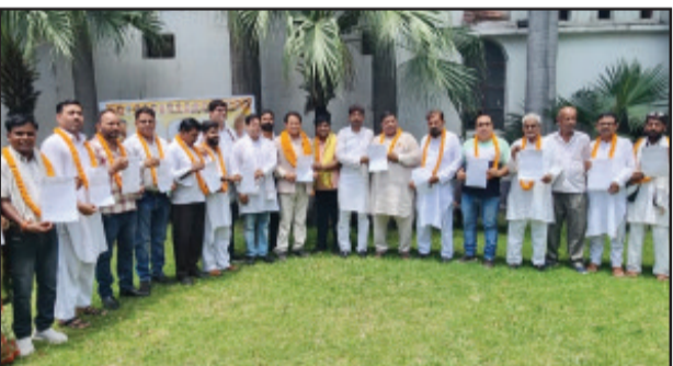
झूठी उपलब्धियों को जनता के बीच ले जाने के लिए महाजन संपर्क अभियान का नाटक किया जा रहा है। उन्होंने कहा कि