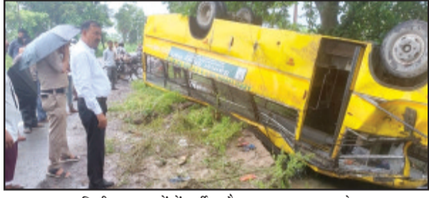
अलग-अलग निजी अस्पतालों में भर्ती कराया गया है। जानकारी के मुताबिक शनिवार सुबह शिवांगी फैक्ट्री की बस संख्या यूके 04 सीए/0137 वर्करों को लेकर फैक्ट्री की ओर जा रही थी इसी

काशीपुर (उद संवाददाता)। रामनगर रोड पर धनोरी के समीप सुबह सवेरे फैक्ट्री की अनियंत्रित बस विद्युत पोल से टकराकर तेज धमाके के साथ पलट गई। हादसे में एक युवक ने मौके पर ही दम तोड़ दिया जबकि तीन दर्जन से अधिक लोग घायल बताए जा रहे हैं। घायलों में महिलाओं की संख्या अधिक है जिन्हें उपचार के लिए नगर के