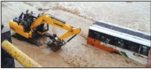
यात्रियों की जान आफत में पड़ गयी। नजीबाबाद से हरिद्वार जा रही इस में सवार यात्रियों को पोकलैंड मशीन की मदद से बमुकिश्ल बचाया गया। जानकारी के अनुसार तेज बारिश होने से भागूवाला क्षेत्र की कोटावाली नदी का (शेष पृष्ठ सात पर)

काशीपुर (उद संवाददाता)। गहतोड़ी पिछले कुछ समय से बीमार चल रहे हैं। यहां मुख्यमंत्री धामी ने गहतोड़ी के परिवार को परिजनों से हाल जाना व उनके