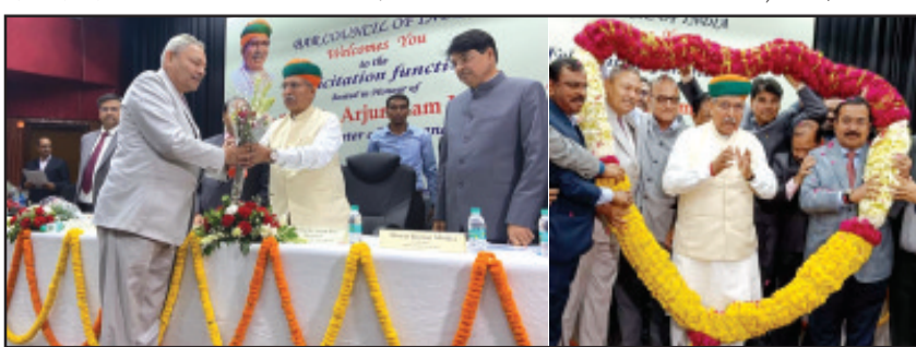
हाईकोर्ट बार में होने वाली गोष्ठी के लिए भी कानून मंत्री को आमंत्रित किया।