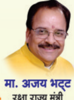
मा. अजय भट्ट रक्षा राज्य मंत्री