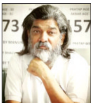
मुताबिक नितिन देसाई कल रात 10 बजे अपने कमरे में चले गए थे। आज सुबह काफी देर तक वो बाहर नहीं आए। तभी उनके बॉडीगार्ड और दूसरे लोगों ने

नई दिल्ली (उद ब्यूरो)। बॉलीवुड के जाने-माने आर्ट डायरेक्टर नितिन देसाई ने बुधवार सुबह खुदकुशी कर ली। रिपोर्ट्स की मानें तो 58 साल के नितिन देसाई ने करजत के एनडी स्टूडियो में फांसी लगाकर आत्महत्या जैसा कदम उठाया। आत्म हत्या का कारण आर्थिक तंगी माना जा रहा है। नितिन देसाई कर्जत में अपने एन डी स्टूडियो में मृत पाए गए हैं। पुलिस मौके पर पहुंचकर जांच में जुट चुकी है। मिली जानकारी के मुताबिक, नितिन देसाई सुबह 4:30 बजे एन डी स्टूडियो में फांसी लगाकर अपनी जान दी। उनकी मौत का कारण पैसों की तंगी बताया जा रहा है। पुलिस सूत्रों के