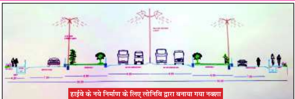
हाईवे के नये निर्माण के लिए लोनिवि द्वारा बनाया गया नक्शा

रुद्रपुर। शहर में इंदिरा चौक से लेकर अटरिया मंदिर मोड़ तक नैनीताल हाईवे का जल्द ही कार्याकल्प होने वाला है। लोक निर्माण विभाग ने इसके लिए तैयारी शुरू कर दी है। हाईवे को चमकाने के लिए 60 करोड़ का टेंडर निकालने की तैयारी भी शुरू हो चुकी है। रुद्रपुर में नैनीताल हाईवे के कार्याकल्प की जरूरत वैसे तो कई वर्षों से महसूस की जा रही थी। लेकिन इस दिशा में अब तक कोई सार्थक प्रयास नहीं हो पाये थे। हाईवे के कार्याकल्प के लिए पहले भी कई बार प्रयास किये थे