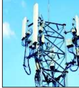
सरकार की तकरीबन सभी जनकल्याणकारी योजनाएं एक के बाद एक डिजिटल होती जा रही है। ऐसे में

- अर्श- रुद्रपुर। भारत 5जी नेटवर्क की तकनीकी में सिद्ध हस्त होने के अब बाद 6जी नेटवर्क की तकनीकी में महारत हासिल करने की ओर कदम बढ़ा रहा है, लेकिन डिजिटल क्रांति के इस दौर में भारत के एक पर्वतीय राज्य उत्तराखंड के अधिकांश विकास खंड का तकरीबन 60 प्रतिशत हिस्सा अभी भी 4जी नेटवर्क का मोहताज है। सूबे के सुदूर पार्वतीय अंचलों में नेटवर्क की सुविधा न होने के कारण यहां के रहवासियों को तमाम तरह की दिक्कतों का सामना करना पड़ता है। भारत