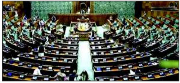
दोनों सदन में हंगामा कर रहे हैं, जिसको सस्पेंड कर दिया गया है। राज्यसभा देखते हुए दोनों सदन की कार्यवाही ने अपमान जनक (शेष पृष्ठ सात पर)

नई दिल्ली (उद ब्यूरो)। संसद में दोपहर 2 तक स्थगित कर दी गई है। वहीं सुरक्षा चूक को लेकर विपक्ष लगातार राज्यसभा में हंगामा कर रहे टीएमसी सरकार पर हमलावर है। विपक्ष के सांसद सांसद डेरेक ओ ब्रायन को सदन से