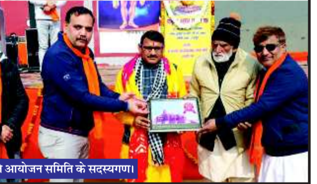
रूद्रपुर के गांधी पार्क में आयोजित सामूहिक हनुमान चालीसा पाठ के दौरान पहुंचे साधू संतों को सम्मानित करते आयोजन समिति के सदस्यगण।