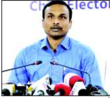
अनुमतियों के लिए अनुरोध प्राप्त हुए। उसमें से 1721 अनुमतियां प्रदान की

जा चुकी हैं। 360 अनुमतियां पूर्ण दस्तावेज न होने अथवा निर्धारित प्रारूप पर न होने के कारण निरस्त की गई हैं। अपर मुख्य निर्वाचन अधिकारी ने कहा कि सी विजिल ऐप में भी राज्य की अच्छी प्रगति है। उत्तराखण्ड देश के शीर्ष तीन राज्यों में अपनी कार्यवाही प्रदर्शित कर रहा है। अभी तक सी विजिल ऐप पर 17 हजार 377 शिकायतें प्राप्त हो चुकी हैं। उसमें से 16 हजार 800 शिकायतों का निस्तारण किया जा