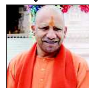
के भव्य मंदिर में कांग्रेस के प्राण प्रतिष्ठा का निमंत्रण स्वीकार नहीं करने को लेकर सियासी हमला बोल सकते हैं। वहीं रक्षा मंत्री राजनाथ सिंह की जनसभाएं भी तय

देहरादून। लोकसभा चुनाव के दौरान प्रधानमंत्री 11 अप्रैल को ऋषिकेश में जनसभा करेंगे। इस जनसभा की इस तरह से रचना बनाई गई है कि इसमें तीन लोकसभा सीटों की 24 विधानसभा क्षेत्र के लोग आएंगे। पार्टी ने एक लाख की भीड़ जुटाने का लक्ष्य बनाया है। वहीं उत्तरप्रदेश के मुख्यमंत्री योगी आदित्यनाथ की तीन जनसभाएं तय हो गई हैं। भाजपा उनकी दो और जनसभा कराने का प्रयास कर रही है। योगी 13 और 14 अप्रैल को उत्तराखंड में चुनाव प्रचार गरमाएंगे। माना जा रहा है कि सीएम योगी अयोध्या नगरी में पांच सौ वर्षों के बाद प्रभु श्री राम मंदिर