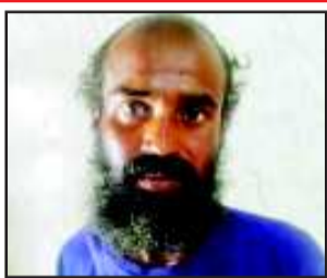
आने की। पुलिस बांग्लादेशी से गहनता से पूछताछ कर रही है। खुफिया विभाग

रुड़की (उद संवाददाता)। बांग्लादेश में बवाल के बीच रुड़की में एक बड़ा मामला प्रकाश में आया है। पुलिस ने एक चोरी छिपे पहचान बदलकर रह रहे एक बांग्लादेशी को गिरफ्तार किया है। पुलिस और खुफिया विभाग अलर्ट हो गया है। सूत्रों का कहना है कि बांग्लादेशी लगातार बयान बदल रहा है। कभी तीन महीने पहले आने की बात बोल रहा है तो कभी तीन दिन पहले