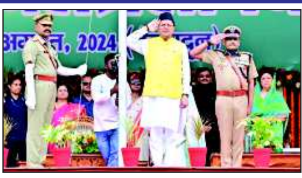
महत्वपूर्ण घोषणाएं भी की। सीएम ने राज्य में उद्योग, बागवानी तथा कृषि के क्षेत्र हजार एवं 50 हजार की धनराशि प्रदान करने का ऐलान किया। साथ ही