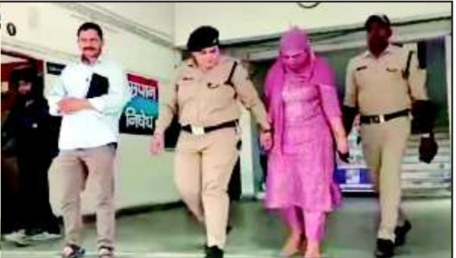
अनुभाग के कंपिटेंट ऑथरिटी लैंड एक्जीक्यूशन (काला) और भारतीय राष्ट्रीय राजमार्ग प्राधिकरण (एनएच एआई) का संयुक्त खाता से 13 करोड़ 51 लाख 46 हजार रुपए के गबन की घटना का खुलासा हो गया है। एसएसपी