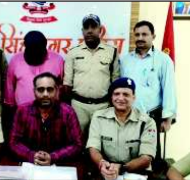
5 करोड़ की धनराशि होल्ड कराई गई है। कुल 13 करोड़ 51 लाख 46 हजार रुपए तीन फर्जी चेकों से निकाले गए थे। सरकारी खाते के फर्जी चेक बैंक में लगाकर करीब 13.51 करोड़ की रकम उड़ाने के मामले में आरोपी बैंक का मैनेजर