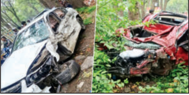
गंभीर रूप से घायल हो गए। जिन्हें इलाज के लिए नजदीकी ग्राफिक एरा अस्पताल में भर्ती किया गया है। पुलिस ने शव को कब्जे में लेकर हादसे की पड़ताल शुरू कर दी है। जानकारी के मुताबिक रॉग साइड से तेज रफ्तार में (शेष पृष्ठ सात पर)

देहरादून (उद संवाददाता)। सड़क हादसे थमने का नाम नहीं ले रहे हैं। एक और हादसे में धूलकोट डाट काली मंदिर के पास तेज रफ्तार तीन कारों की आपस में भिड़ंत हो गई। हादसे में एक व्यक्ति की मौके पर मौत हो गई, जबकि कार सवार तीन लोग