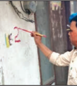
कर्मचारी लाल निशान लगाने में जुटे हैं। बताया जा रहा कि अब तक तीन सौ से अधिक अवैध भवनों पर यह निशान लगा

रुद्रपुर (उद संवाददाता)। जिला विकास प्राधिकरण द्वारा जिलाधिकारी के निर्देश पर विगत दिवस फाजलपुर, प्रीत विहार में सीलिंग व सरकारी भूमि पर अवैध रूप से बनाए जा रहे भवनों को जेसीबी मशीन से ध्वस्त करने के बाद अब मौहल्ला पहाड़गंज में अवैध रूप से बनाया गए भवनों पर क्रमांक के साथ लाल निशान लगाने का काम शुरू करने से स्थानीय लोगों में हड़कंप मच गया है। जिला विकास प्राधिकरण के