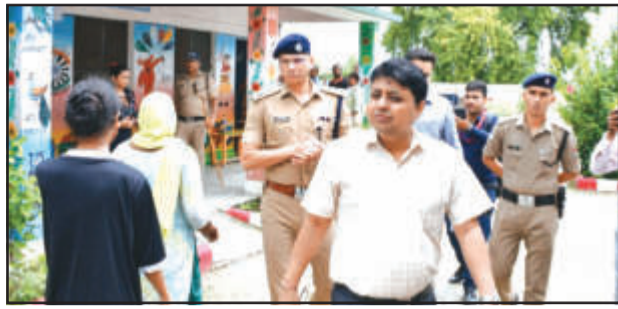
भतीजे एवं भाजपा नेता ने मतदान करने आए ग्रामीणों के परिचय पत्र तथा अन्य