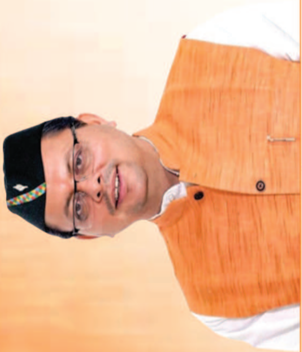
पुष्कर सिंह धामी मुख्यमंत्री, उत्तराखण्ड