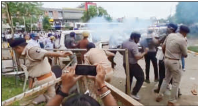
शनिवार को गहमा गहमी के बीच मतदान हुआ। मतदान सुबह आठ बजे से दोपहर दो बजे तक हुआ। देर शाम परिणाम घोषित किए जाएंगे। हल्द्वानी- यहां छात्र

देहरादून/हल्द्वानी/रुद्रपुर/ रामनगर। प्रदेश के राजकीय महाविद्यालयों में शनिवार को छात्रसंघ चुनाव के लिए मतदान हुआ। हल्द्वानी में चुनाव के दौरान जमकर बवाल हुआ। दोनों के दो गुटों में संघर्ष की स्थिति पैदा हो गयी। जिसके बाद पथराव भी हुआ। उपद्रवियों को शांत करने के लिए पुलिस ने लाठी चार्ज किया और आंसू गैस के गोले भी छोड़े। जानकारी के अनुसार तीन विश्वविद्यालयों में श्रीदेव सुमन, कुमाऊं विवि व सोबन सिंह जीना विवि एवं एचएनबी गढ़वाल केंद्रीय विश्वविद्यालय के परिसरों एवं संबद्ध राजकीय व सहायता प्राप्त अशासकीय महाविद्यालयों में छात्र संघ के लिए