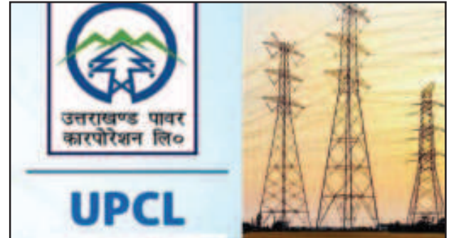
और जहां आम लोगों को राहत देकर थोड़ी बहुत खुशी देने की कोशिश की, तो वहीं दूसरी ओर बिजली महकमे ने तुरंत बाद ही बिजली की दरों में वृद्धि करके

फ्यूल पावर परचेज कास्ट एडजस्टमेंट के तहत यूपीसीएल ने बढ़ाई बिजली की दरें, अक्टूबर माह के लिए छह पैसे से लेकर 26 पैसे प्रति यूनिट तक महंगी हुई बिजली