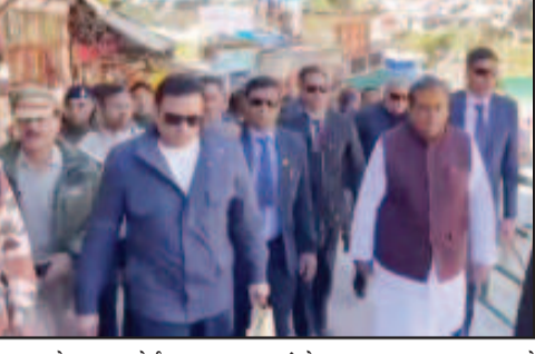
एयरपोर्ट पर उतरा, जहां से वह लगभग 8:30 बजे हेलिकॉप्टर के माध्यम से

देहरादून (उद संवाददाता)। रिलायंस इंडस्ट्रीज के चेयरमैन और मैनेजिंग डायरेक्टर मुकेश अंबानी शुक्रवार सुबह विशेष विमान से देहरादून एयरपोर्ट पहुंचे। एयरपोर्ट पर कुछ समय रुकने के बाद वे दो हेलिकॉप्टरों के जरिए अपने सहयोगियों सहित बदरीनाथ और केदारनाथ धाम के दर्शन के लिए रवाना हुए। सुबह करीब 8:00 बजे मुकेश अंबानी का विमान देहरादून