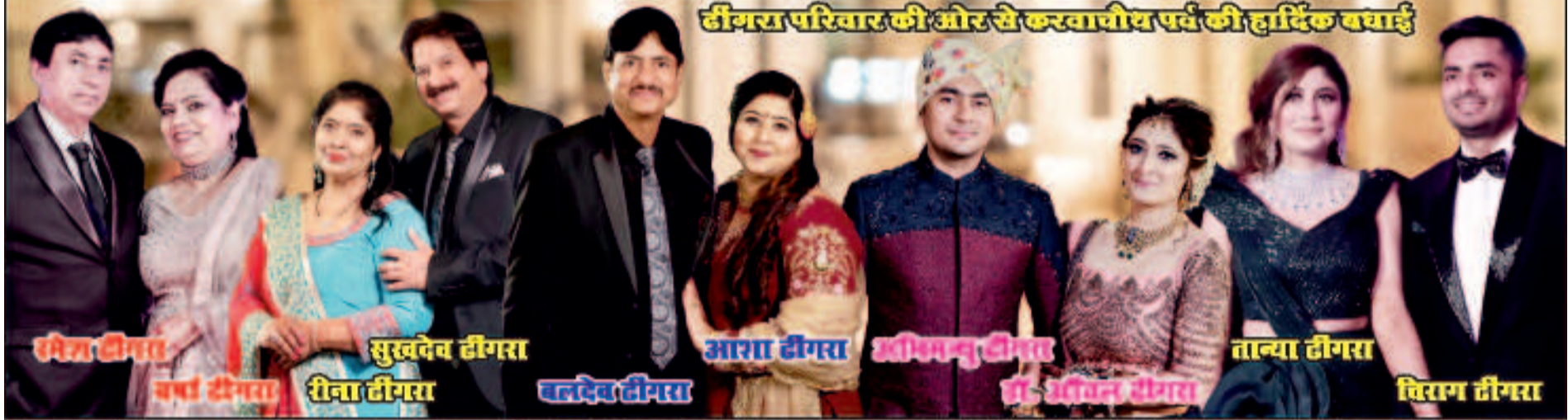
दीगरा परिवार की ओर से करवाचीय पर्व की हार्दिक बधाई