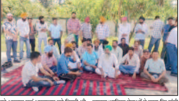
रहे अन्याय एवं अत्याचार को किसी भी कीमत पर बर्दाश्त नहीं किया जाएगा। उन्होंने चेतावनी दी कि यदि प्रशासन और आदृती एजेंसियों ने जल्द समाधान नहीं किया तो आंदोलन को और उग्र रूप दिया