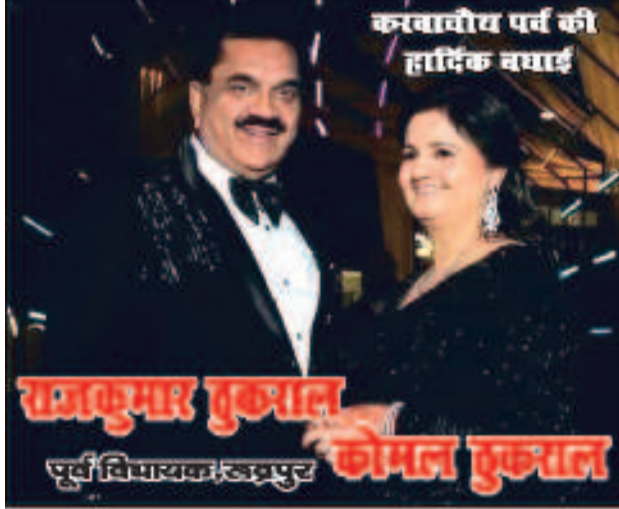
करवाचीय पर्व की हार्दिक बधाई राजकुमार कुकhal कीमल कुकhal पूर्व विधायक लद्दापुर