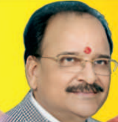
श्री अजय भट्ट मा.सांसद, नैनीताल एवं पूर्व रक्षा राज्य मंत्री