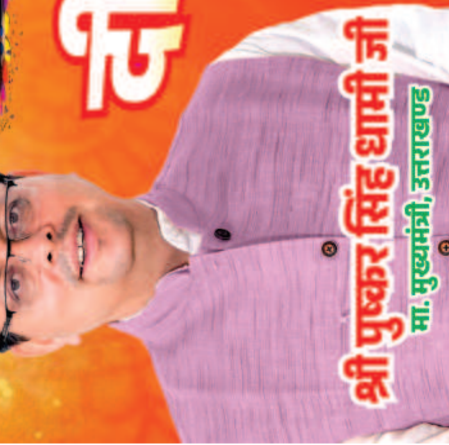
श्री पुष्कर सिंह धामी जी मा. मुख्यमंत्री, उत्तराखण्ड