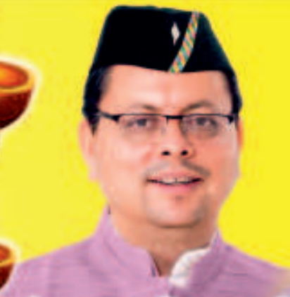
श्री पुष्कर सिंह धामी मा.मुख्यमंत्री उत्तराखण्ड