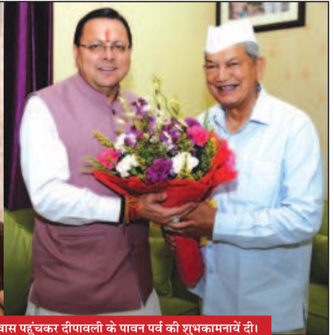
सीएम पुष्कर सिंह धामी ने पूर्व मुख्यमंत्री बीसी खंडूड़ी, पूर्व सीएम डा. रमेश पोखरियाल निशंक एवं पूर्व सीएम हरीश रावत के आवास पहुंचकर दीपावली के पावन पर्व की शुभकामनायें दी।