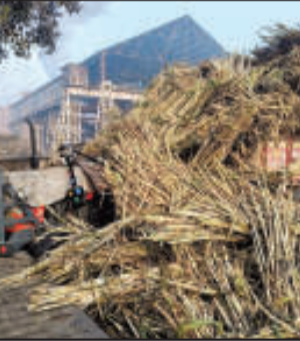
बाद चालक ने कुछ दूरी पर खड़ी कर दी। प्रत्यक्षदर्शियों के अनुसार ढलान होने के चलते ट्रैक्टर ट्राली अचानक चलने लग

किच्छा। चीनी मिल में गन्ने से भरी लोडेड ट्रैक्टर ट्रॉली बिना चालक के ढलान पर चलने का बाद पलटने से गन्ने के नीचे दबने से ट्रैक्टर चालक गंभीर रूप से घायल हो गया। घायल चालक को इलाज के लिए तुरंत हायर सेंटर जिला अस्पताल ले जाया गया। जहां उसकी हालत गंभीर बताई जा रही है। जानकारी के अनुसार चीनी मिल परिसर में उस समय अफरा तफरी मच गई जब गन्ना सेंटर से गन्ने की भरी ट्रॉली टेल कांटे पर वजन करवाने के