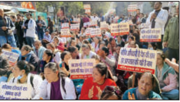
अभ्यर्थियों का कहना है कि सरकार और प्रशासन की ओर से उन्हें बार-बार केवल मौखिक आश्वासन मिल रहे हैं, जबकि धरातल पर कोई ठोस कार्रवाई नहीं हो रही है। इसी से निराशा होकर सोमवार को आंदोलित बेरोजगारों ने आर-पार की

देहरादून (उद संवाददाता)। उत्तराखंड में नर्सिंग भर्ती प्रक्रिया को लेकर चल रहा विवाद अब सड़कों पर उतर आया है। लंबे समय से अपनी मांगों को लेकर आंदोलन कर रहे सैकड़ों नर्सिंग अभ्यर्थियों ने सोमवार को प्रदेश सरकार के खिलाफ मोर्चा खोलते हुए मुख्यमंत्री आवास कूच किया। हाथों में पोस्टर-बैनर लिए और सरकार विरोधी नारेबाजी करते हुए अभ्यर्थियों ने भर्ती प्रक्रिया में हो रही देरी और विसंगतियों पर कड़ा रोष प्रकट किया। बता दें कि नर्सिंग एकता मंच के बैनर तले ये अभ्यर्थी पिछले 40 दिनों से एकता विहार धरना स्थल पर डटे हुए हैं।