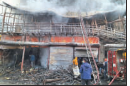
अगस्त्यमुनि की टीम में अत्याधुनिक उपकरणों के साथ तत्काल मौके पर पहुंची। स्थानीय ग्रामीणों और पुलिस के सहयोग से बचाव कार्य शुरू किया गया। आग की तीव्रता को देखते हुए रिन्यू जल ऊर्जा कुंड के कर्मचारियों ने भी सक्रिय