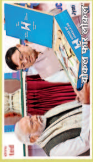
वोकल फार लोकल