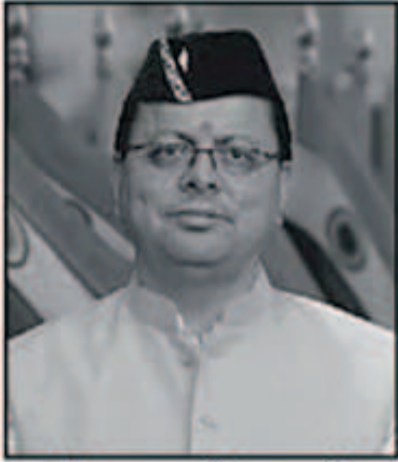
श्री पुष्कर सिंह धामी मा. मुख्यमंत्री, उत्तराखण्ड