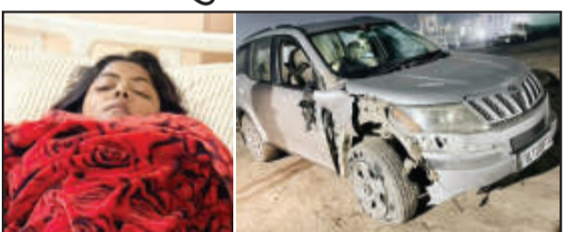
के प्रयास में अनियंत्रित कार ने सामने से आ रही बाइक को भीषण टक्कर मार दी। इस दर्दनाक हादसे में बाइक सवार युवती समेत तीन लोग लहलुहान होकर सड़क पर गिर पड़े। टक्कर इतनी जबरदस्त थी कि बाइक के परखच्चे उड़ गए। हादसे

दिनेशपुर (उद संवाददाता)। दिनेशपुर मार्ग पर एक तेज रफ्तार कार के कहर ने तीन जिंदगियों को संकट में डाल दिया। टाटा मैजिक को ओवरटेक करने