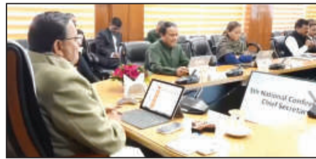
का ऐतिहासिक निर्णय लिया है। तत्कालीन परिस्थितियों में उद्योगों को केवल सरप्लस (अतिरिक्त लाभ) होने पर ही बोनस देने का प्रावधान किया गया था। चूंकि यह संशोधन राष्ट्रपति भवन

देहरादून (उद संवाददाता)। मुख्यमंत्री पुष्कर सिंह धामी की अध्यक्षता में बुधवार को आयोजित प्रदेश मंत्रिमंडल की बैठक में छह महत्वपूर्ण प्रस्तावों पर मुहर लगी। कैबिनेट ने श्रम, गृह, वन और कृषि विभाग से जुड़े कई संवेदनशील और विकासोन्मुखी निर्णयों को मंजूरी दी है। बैठक के सबसे बड़े फैसले के तहत श्रम विभाग से संबंधित 'पेमेंट ऑफ बोनस एक्ट 2020' को वापस लेने का निर्णय लिया गया है, जिससे अब प्रदेश के श्रमिकों को केंद्रीय कानून के तहत बोनस का लाभ मिल सकेगा। मंत्रिमंडल ने कोविड काल के दौरान लाए गए 'पेमेंट ऑफ बोनस एक्ट 2020' को वापस लेने