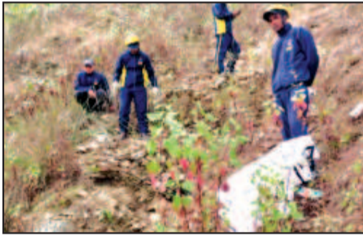
सड़क से फिसल कर सीधे गहरी खाई में जा समाया। हादसे की आवाज सुनकर स्थानीय लोग मौके पर एकत्र हो गए और

वाहन गुरना के निकट पहुंचा, चालक अचानक नियंत्रण खो बैठा और टिप्पर