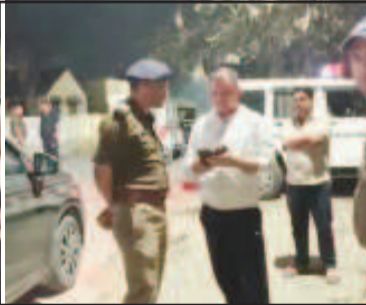
वहां पर ओर डांस करती महिलाओं की वीडियो बनाने लगे। जिसका वहां मौजूद लोगों ने कड़ा विरोध किया। तभी एक