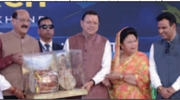
प्रतिबद्धता दोहराते हुए बताया कि इस वर्ष महोत्सव के माध्यम से नए ट्रैकिंग रूटों को विकसित किया गया है, जहाँ स्थानीय काइट फेस्टिवल जैसी रोमांचक गतिविधियां पर्यटकों को रोमांचित करेंगी। साथ ही, बॉलीवुड के प्रसिद्ध संगीतकार अमित

त्रिवेदी और उत्तराखंड के सुप्रसिद्ध लोक बैंड शपांडवाजश की प्रस्तुतियां महोत्सव की शामों को यादगार बनाएंगी। उत्तराखंड पर्यटन विकास परिषद और जिला प्रशासन ने इस बार प्रतियोगिताओं को अधिक आकर्षक बनाया है। आयोजन के दौरान मास्टर शोफ, फोटोग्राफी, पेंटिंग, सोशल मीडिया रील मेकिंग, ग्रुप फैशन शो, मिस्टर एंड मिस टिहरी, राफ्टिंग और रैप सिंगिंग जैसी विभिन्न स्पर्धाएं आयोजित की जा रही हैं। इन प्रतियोगिताओं के लिए कुल 25 लाख रुपये का पुरस्कार (शेष पृष्ठ सात पर)