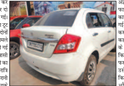
सामने एक बाईक पर दो अज्ञात व्यक्ति उसकी कार के बराबर में आये जिनको

में सिटीवन 1 नम्बर गेट बड़े आर ए एन स्कूल के पीछे असेनिया रेस्टोरेन्ट के