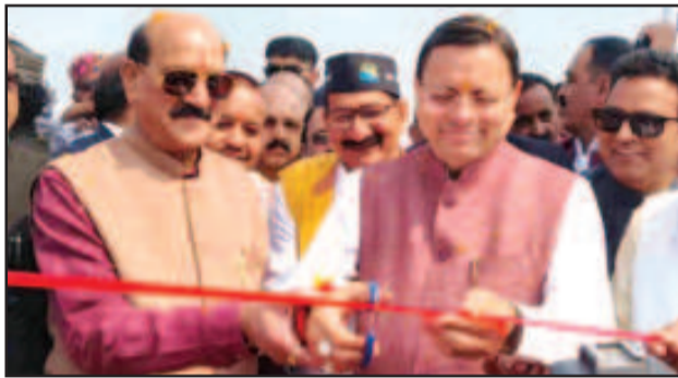
शिलान्यास भी किया, जिससे क्षेत्र में विकास की नई धारा बहने की उम्मीद है। समारोह को संबोधित करते हुए मुख्यमंत्री पुष्कर सिंह धामी ने कहा कि प्रधानमंत्री नरेंद्र मोदी के विजन के अनुरूप उत्तराखंड अब 'वर्षभर पर्यटन' के वैश्विक केंद्र के

नई टिहरी (उद संवाददाता)। मुख्यमंत्री पुष्कर सिंह धामी ने शुक्रवार को टिहरी झील के सुरम्य तट कोटी कॉलोनी में चार दिवसीय भव्य 'हिमालयन-02 टिहरी लेक फेस्टिवल 2026 का विधिवत दीप प्रज्वलित कर शुभारंभ किया। 06 से 09 मार्च तक आयोजित होने वाला यह महोत्सव साहसिक पर्यटन, समृद्ध लोक संस्कृति और आधुनिक कला के एक अद्भुत संगम के रूप में उभरकर सामने आया है। इस अवसर पर मुख्यमंत्री ने जनपद के विकास के लिए करोड़ों रुपये की महत्वपूर्ण योजनाओं का लोकार्पण और