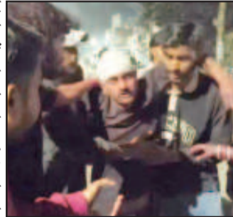
वहां पर ओर डांस करती महिलाओं की वीडियो बनाने लगे। जिसका वहां मौजूद लोगों ने कड़ा विरोध किया। तभी एक

जिला अस्पताल में भर्ती कराया गया है। घटनाक्रम के अनुसार मोहल्ले में लोग होली का उत्सव मना रहे थे। इस दौरान