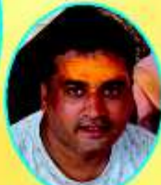
पवन खनिजों रुद्रपुर