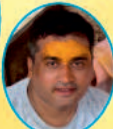
पवन खनिजों रुद्रपुर