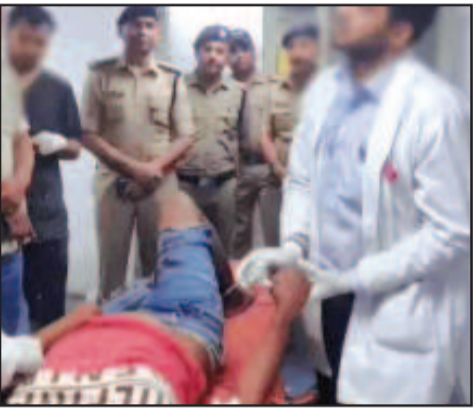
एसएसपी के निर्देश पर तत्काल सभी चेक पोस्ट अलर्ट किए गए। पीछा करने के दौरान कुआंवाला से करीब एक किमी आगे कार अनियंत्रित होकर एक हाईवे बोर्ड से टकरा गई। इसके बाद आरोपी जंगल की ओर

देहरादून (उद संवाददाता)। 'ऑपरेशन प्रहार' के तहत अपराधियों के विरुद्ध चलाए जा रहे अभियान के दौरान बीती रात देहरादून पुलिस और एक शातिर बदमाश के बीच मुठभेड़ हो गई। पुलिस की जवाबी फायरिंग में बदमाश पैर में गोली लगने से घायल हो गया, जिसे उपचार के लिए दून अस्पताल में भर्ती कराया गया है। घटना की जानकारी मिलते ही एसएसपी देहरादून ने मौके पर पहुंचकर स्थिति का जायजा लिया। जानकारी के अनुसार, 16 अप्रैल की मध्य रात्रि पुलिस कंट्रोल रूम को हरवाला क्षेत्र में एक संदिग्ध सफेद स्विफ्ट कार के घूमने की सूचना मिली थी। जब पुलिस टीम मौके पर पहुंची, तो कार