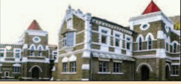
उपाध्याय की खंडपीठ ने स्पष्ट किया कि बॉन्ड धारी चिकित्सकों को तीन साल तक पहाड़ में अपनी सेवाएं देनी ही होगी। खंडपीठ ने यह भी स्पष्ट किया कि सरकार बॉन्ड धारी चिकित्सकों को दुर्गम क्षेत्र में तीन साल से अधिक की सेवा देने के लिए बाध्य नहीं करेगी। खंडपीठ ने अपने निर्णय में कहा कि यदि

अब बॉन्ड धारी डॉक्टर भी चढ़ेंगे पहाड़, एमबीबीएस के बाद दुर्गम क्षेत्रों में दी गई सेवा को अनिवार्य सेवा अवधि में जोड़ा जाएगा