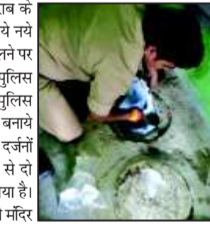
रुद्रपुर (उद संवाददाता)। अवैध शराब के कारोबार में लिप्त लोग शराब बिक्री के नये नये तरीके निकाल रहे हैं। पूर्व में गुप्त सूचना मिलने पर औचक दबिश देने के बाद भी जिस जगह पुलिस के हाथ हमेशा खाली रहते थे आज वहीं पुलिस टीम को दुकान के अन्दर रखे सोफे के नीचे बनाये गये गड्ढे में रखे दो ड्रमों से अवैध शराब के दर्जनों पाउच बरामद कर लिए। पुलिस ने मौके से दो महिलाओं को अपनी हिरासत में भी ले लिया है। जानकारी के अनुसार पुलिस को रमपुरा काली मंदिर के पास अवैध शराब का कारोबार संचालित होने की जानकारी मिल रही थी। कई बार दबिश देने के बाद भी पुलिस के हाथ कुछ नहीं (शेष पृष्ठ सात पर)