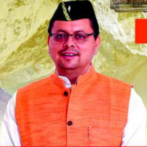
पुष्कर सिंह धामी मुख्यमंत्री, उत्तराखण्ड

“माननीय प्रधानमंत्री जी ने 21वीं सदी के तीसरे दशक को उत्तराखण्ड का दशक कहा है। हम प्रधानमंत्री जी के विजन के अनुरूप राज्य को हर क्षेत्र में आदर्श राज्य बनाने के लिये विकल्प रहित संकल्प के साथ काम कर रहे हैं।”