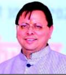
और मेट्रो नेटवर्क भी कई गुना बढ़ा है। धामी ने कहा कि प्रधानमंत्री के नेतृत्व में भारत वैश्विक स्तर पर नई पहचान बना रहा है। डिजिटल भुगतान के क्षेत्र में भारत दुनिया का नेतृत्व कर रहा है और वैश्विक डिजिटल लेनदेन का बड़ा हिस्सा भारत में हो रहा है। रक्षा उत्पादन, अंतरिक्ष विज्ञान, कृत्रिम बुद्धिमत्ता, स्टार्टअप और सेमीकंडक्टर

विकास परियोजनाओं पर कार्य चल रहा है। चारधाम ऑल वेदर रोड परियोजना, दिल्ली देहरादून एक्सप्रेसवे सहित अनेक महत्वपूर्ण सड़क परियोजनाएं तेजी से आगे बढ़ रही हैं। सितारगंज टनकपुर, पौंटा साहिब देहरादून, भानियावाला ऋषिकेश, काठगोदाम लालकुआं हल्द्वानी बाईपास तथा रुद्रपुर बाईपास जैसी परियोजनाएं राज्य की कनेक्टिविटी को नई गति प्रदान करेंगी। उन्होंने कहा कि लंबे समय से उत्तराखंड के लोगों का सपना रही ऋषिकेश (शेष पृष्ठ सात पर)