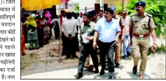
मुकाबला रोचक बना हुआ है और प्रत्याशियों के समर्थकों में भी उत्साह दिखाई दे रहा है। जिलाधिकारी/जिला

काशीपुर (उद संवाददाता)। जिले की नवगठित गढ़नेगी नगर पंचायत में पहले निकाय चुनाव के लिए शांतिपूर्ण मतदान हुआ। सुबह 8 बजे मतदान प्रक्रिया शुरू होते ही विभिन्न मतदान केंद्रों पर मतदाताओं की लंबी कतारें देखने को मिलीं। क्षेत्रवासियों में अपने पहले जनप्रतिनिधियों को चुनने को लेकर खासा उत्साह नजर आ रहा है। बता दें गढ़नेगी को हाल ही में नगर पंचायत का दर्जा मिलने के बाद यह पहला चुनाव है। नगर पंचायत अध्यक्ष पद के साथ 7 सदस्य पदों के लिए भी मतदान कराया जा रहा है। अध्यक्ष पद अनारक्षित होने के कारण