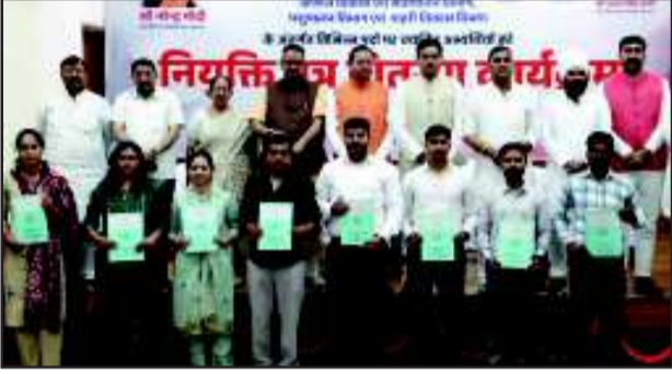
राज्य सरकार युवाओं को रोजगार उपलब्ध कराने के लिए निरंतर प्रयासरत है। उन्होंने कहा कि सरकार की पारदर्शी भर्ती प्रक्रिया के कारण आज युवाओं का सरकारी व्यवस्थाओं पर विश्वास मजबूत हुआ है। उत्तराखण्ड में सरकारी नौकरियों में लंबे समय तक भ्रष्टाचार, सिफारिश और भाई भतीजा वाद की

हल्द्वानी (संवाददाता)। शहर के शनि बाजार रोड पर सोमवार शाम हुए दर्दनाक सड़क हादसे में 13 वर्षीय बच्ची की मौत हो गई। तेज रफ्तार कैंटर की टक्कर से स्कूटी सवार बच्ची वाहन के पहिये के नीचे आ गई, जिससे उसकी मौके पर ही मौत हो गई। हादसे के बाद क्षेत्र में भारी आक्रोश फैल गया और बड़ी संख्या में लोग घटनास्थल पर जुट गए। जानकारी के अनुसार मृतक बच्ची मूल रूप से उत्तर प्रदेश के मुगदाबाद की रहने वाली थी और इन दिनों हल्द्वानी स्थित अपनी नानी के घर आई हुई थी। सोमवार शाम वह अपनी बहन के साथ स्कूटी से बाजार जा रही थी। इसी दौरान शनि बाजार रोड पर सामने से आ रहे तेज (शेष पृष्ठ सात पर)